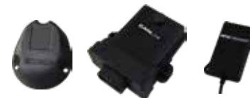
MODULI PER SISTEMI REMOTI