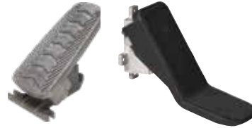
PEDALI ACCELERATORI ELETTRONICI